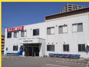
《 外 観 》