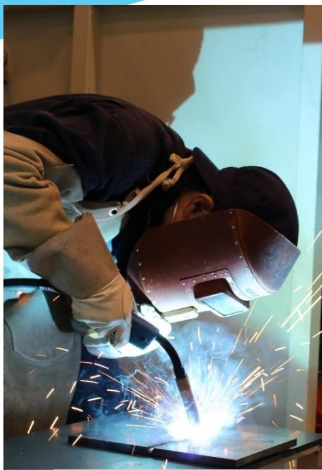
未経験者対象で 基礎から学べる