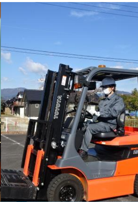
現場に役立つ 資格を取得