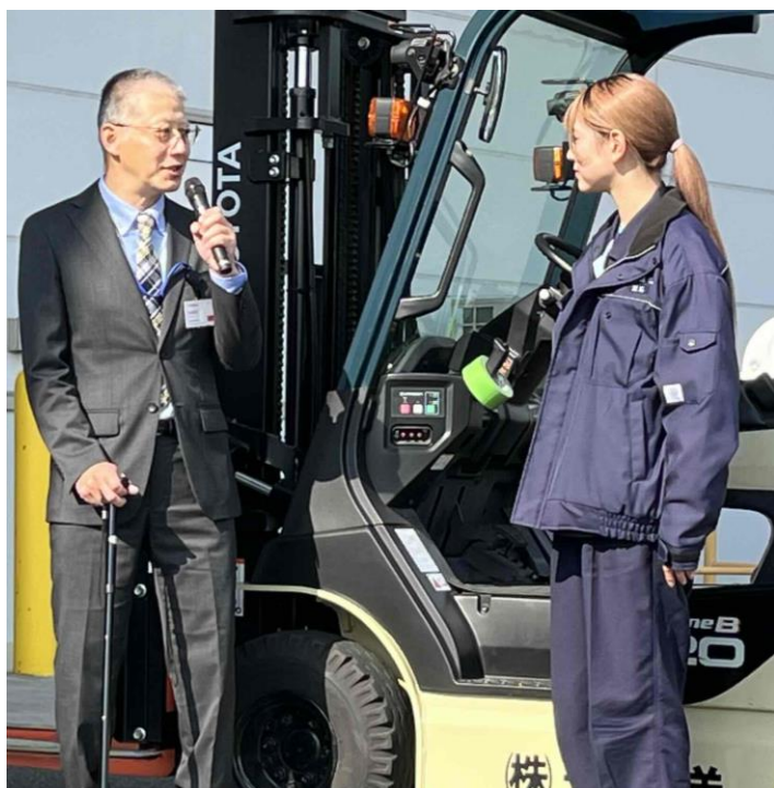
若手社員さんにインタビューする友住労働局長（左）