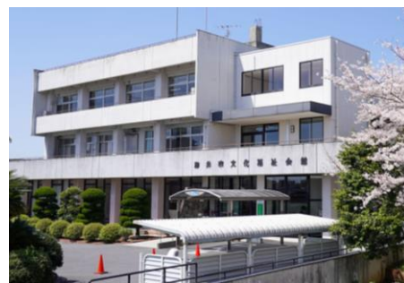
柳井市文化福祉会館内 (HPより)