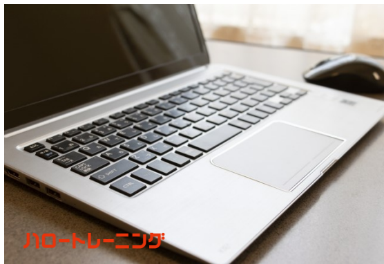
ハートトレーニング