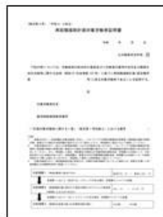
再就職援助計画 対象労働者証明書

貴社に雇い入れられる直前の離職の際に「再就職援助計画対象労働者」であった方 再就職援助計画対象労働者は、「再就職援助計画対象労働者証明書」をお持ちですので、 採用応募時や面接時に証明書の有無を確認してください。