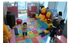
全オフィスに保育士を常駐安心してお仕事探しに専念