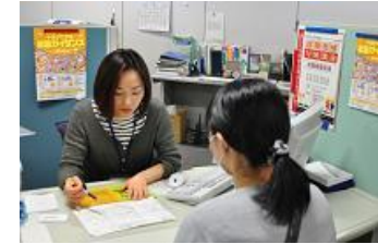
【ジョブサポーター相談風景】