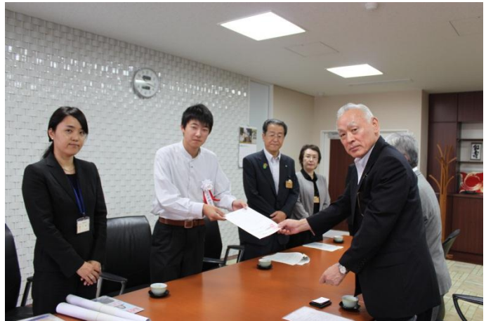
⑤ (対応者) 山形商工会議所連合会 専務理事