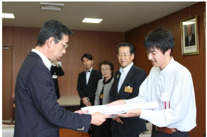
⑦ (対応者) 山形県商工会連合会 専務理事