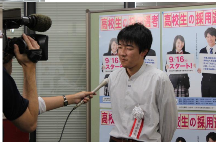
③ テレビ局のインタビュー対応