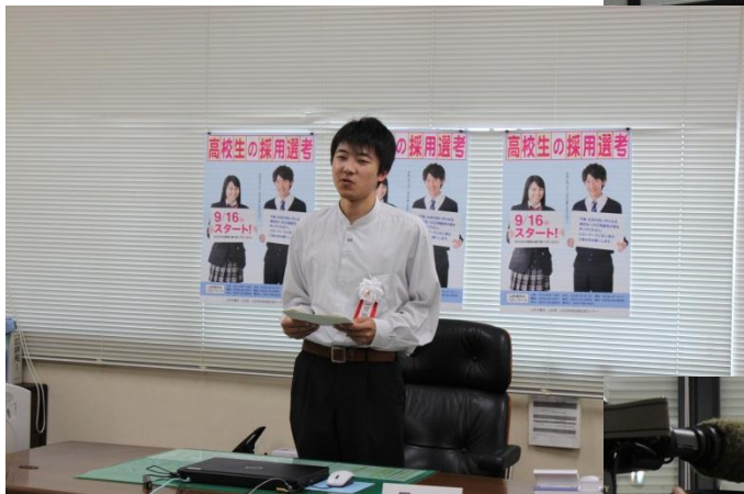
② 労働局長席で就任挨拶