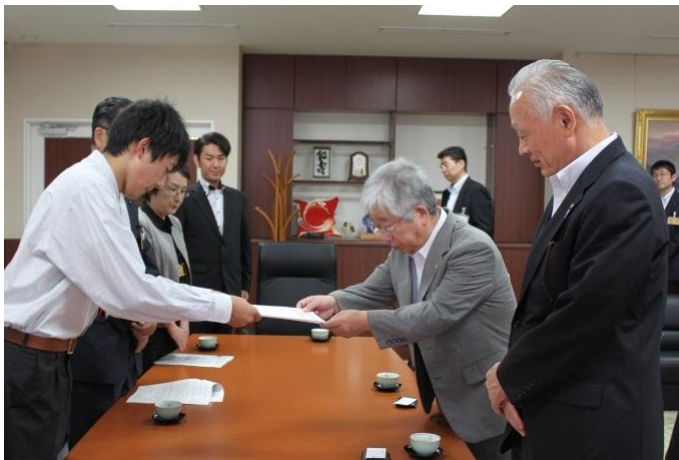
⑥ (対応者) 山形商工会議所 理事・事務局長