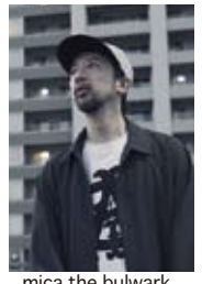
mica the bulwark