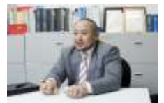
業界に精通した コンサルタントが サポートいたします