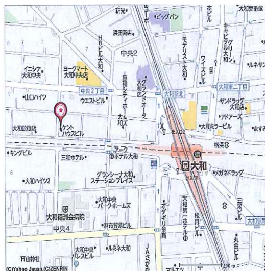
小田急線 相鉄線 大和駅より徒歩5分

給 与: 時間給、諸手当、有給休暇を含む総支給額 福 利 費 等: 健康保険、介護保険、厚生年金、雇用保険、労災保険、健康診断等 会社運営費: 人件費、オフィス、事務経費、募集広告費等会社運営にかかる諸経費 営 業 利 益: 上記経費を差引いた会社の利益