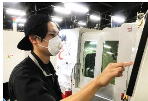
N Cオペレーション科 (企業実習付きコース)

工具研削盤を用いた切削工具の加工、プログラムの作成を行っています。図面をもとに数値を入力し、思い通りの形になったときにやりがいを感じます。