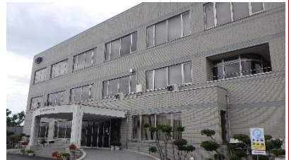
▲株式会社山形ビルサービス 社屋

設備管理員は、特に電気に関する知識が一番重要視されます。基本を身につけている修了生は必要不可欠な存在です。