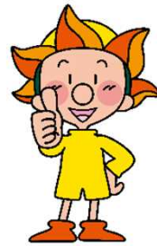
「ヤッピー」 山形労働局 イメージキャラクター

「未来」にわたって「人」と「暮らし」を守る 労働局の仕事について、聞いてみませんか？