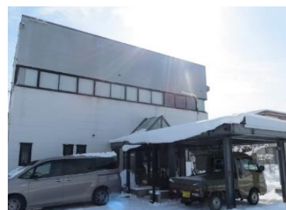
▲有限会社三泰工業所社屋

ポリテクの受講者は即戦力になるためとても信頼しています。基礎を学んできているので、指導もスムーズです。異業種から挑戦する方が多いと思うので、自分の好きなことを見つけてやりがいにしてほしいです。