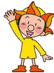
「ヤッピー」 山形労働局 イメージキャラクター

「未来」にわたって「人」と「暮らし」を守る 労働局の仕事の内容、聞いてみませんか？