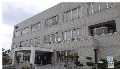
▲株式会社山形ビルサービス 社屋

設備管理員は、特に電気に関する知識が 一番重要視 されます。 基本を身につ けている修了生は必要不可欠な存在です。