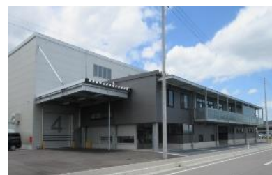
▲内山電機工業株式会社 社屋