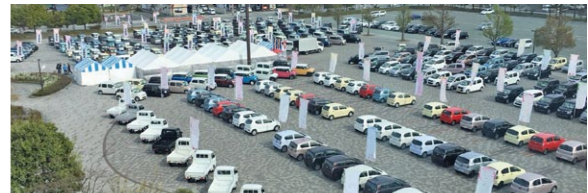
出張展示会 (山形国際交流プラザ/山形ビッグウイング)

At a car fair, we sold 150 cars in three days, an unprecedented sales record for the industry!