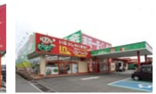
酒田店 Sakata Store