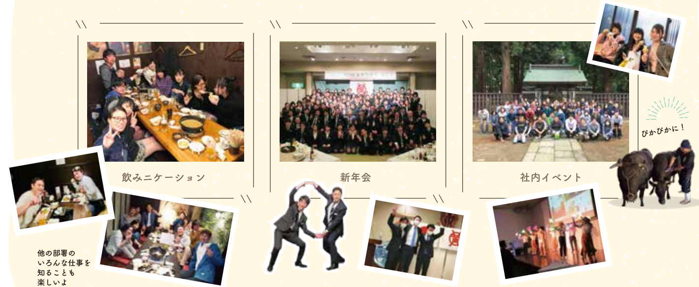
他の部署の いろんな仕事を 知ることも 楽しいよ

私たちは、沢山の仲間たちと一緒に仕事をしています。一人一人の個性やエネルギーが集まって 米沢牛黄木という会社が作られています。そう、「人が企業」というのが私たちの考え方です。 同じ部署の仲間だけでなく、他の部署の人ともいろんな会社行事を通じて、楽しく！熱く！チャレンジを続けています。