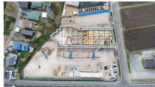
⑧ (令和4年5月中旬) 1階躯体工事 施工中