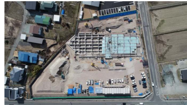
⑥ (令和4年3月下旬) ピット土間・1階床工事 施工中