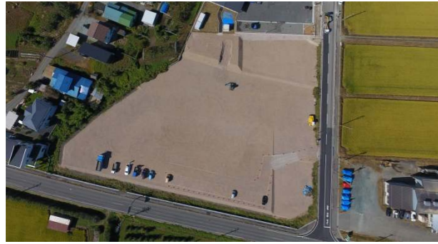
① (令和3年9月下旬) 着工前