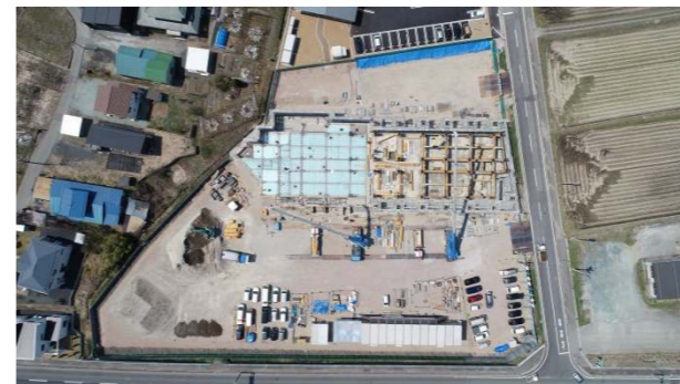
⑦ (令和4年4月中旬) 1階床・1階躯体工事 施工中