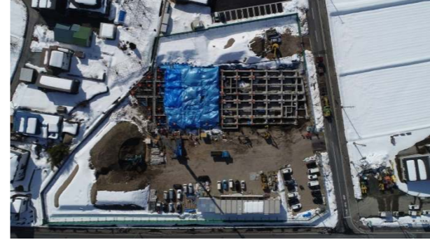
⑤ (令和4年2月下旬) 基礎工事 施工中