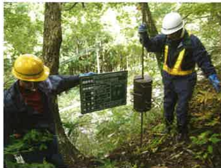
スウェーデン式サウンディング試験