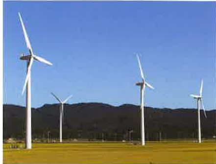
庄内町のシンボル「風車」