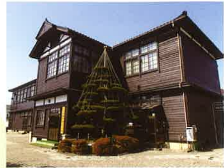
本社 [旧大和村大和小学校校舎を移築]