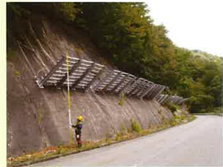
雪崩予防施設設計