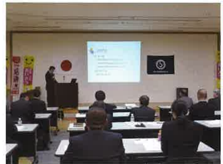
社内研修会 技術発表