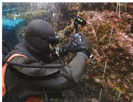
付着生物潜水調査