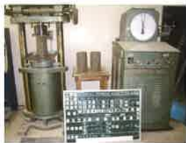
土の一軸圧縮試験