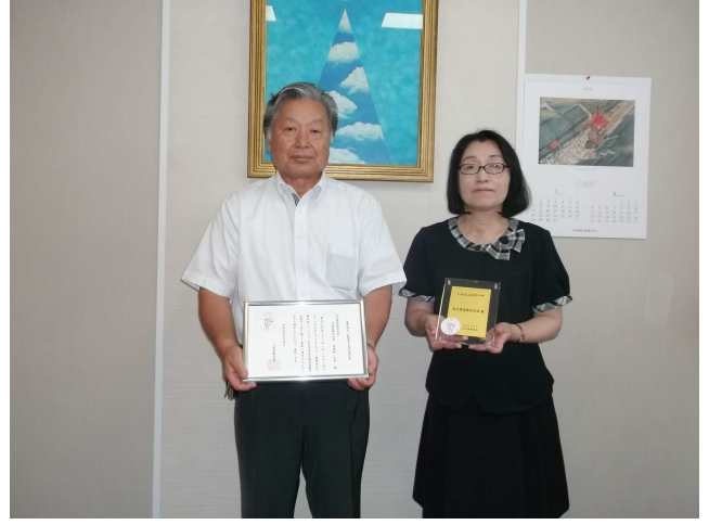
令和元年7月29日 認定通知書及び認定楯の交付