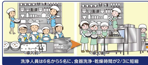
洗浄人員は6名から5名に、食器洗浄・乾燥時間が2/3に短縮