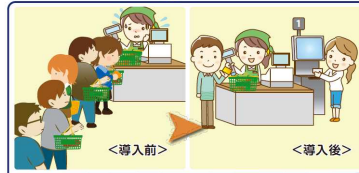
レジの精算時間が1.5倍の速さになり、預り金や釣銭の受け渡しの間違いがなくなった