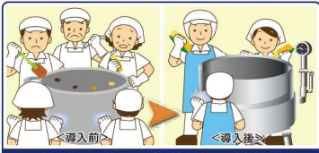
一度に大量の仕込みが可能となり、清掃人員は5名から3名に、1日で100分の清掃時間が短縮