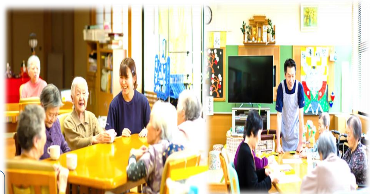
スタッフも利用者の方も楽しく笑顔で過ごしています♪