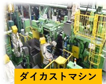
ダイカストマシン