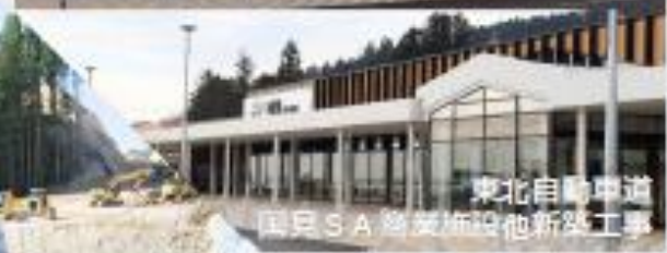
東北自動車道 国見SA 遮断施設他新築工事