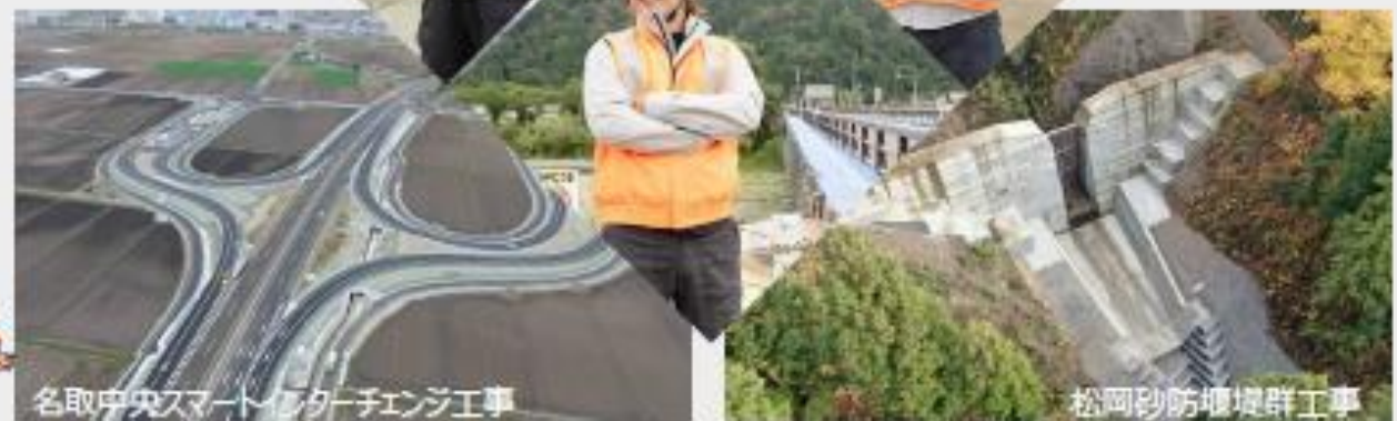
名取中央スマートインターチェンジ工事