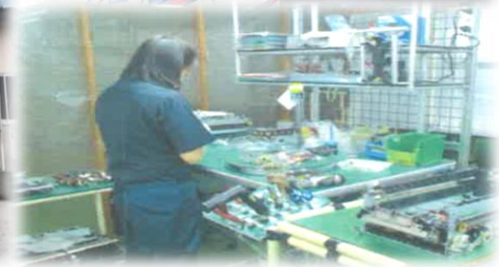
作業風景 (テクニカルセンター)