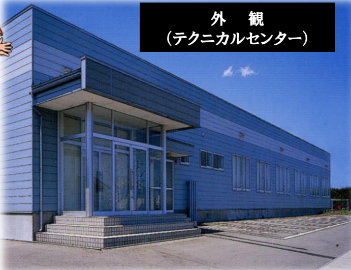
外観 (テクニカルセンター)