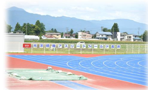
長井市陸上競技場の命名権を取得しています！