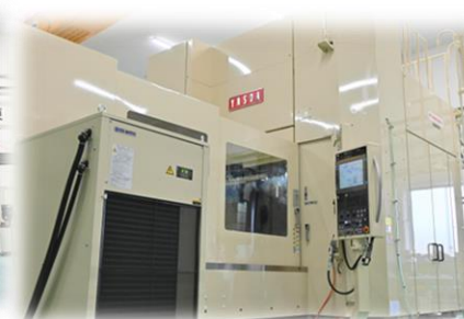
マシニングセンタ