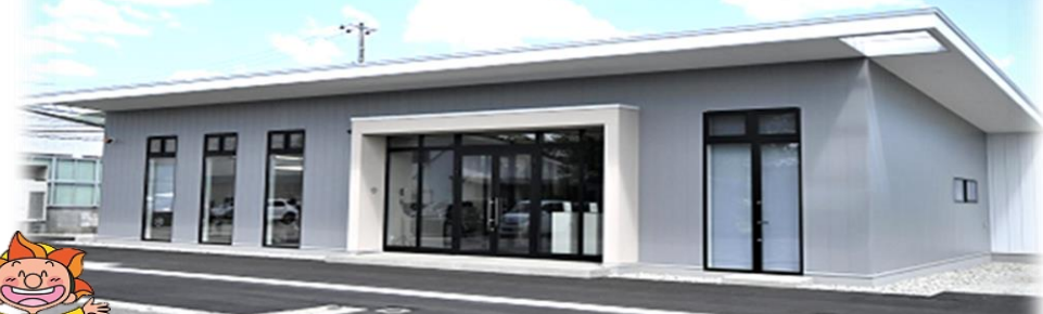
事務所【令和6年3月完成】