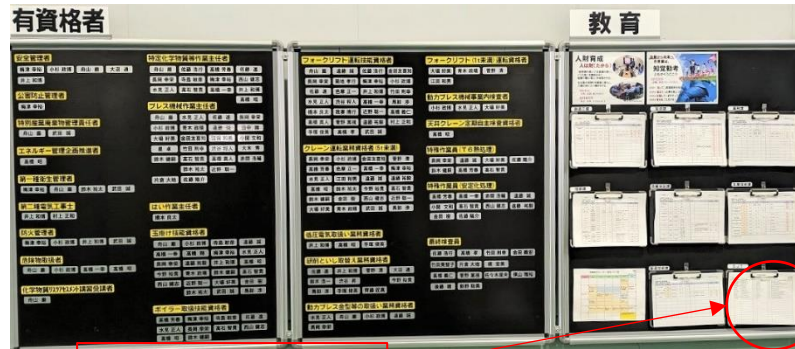
一人一人の教育計画