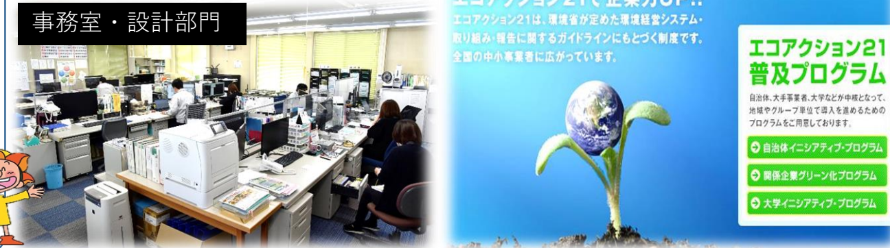
事務室・設計部門