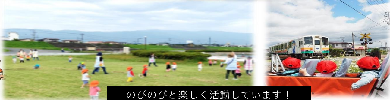
のびのびと楽しく活動しています！