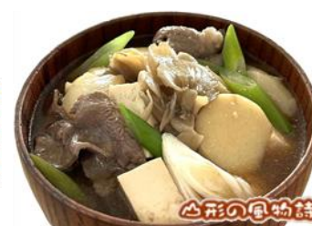
《醤油ベースの味噌タッブリ》牛肉 里芋 舞茸 豆腐 平蒟蒻 長葱