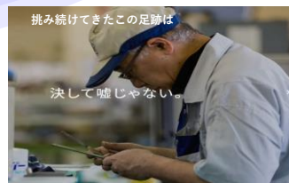
挑み続けてきたこの足跡は