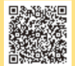
ハローワークさがえHP