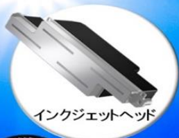
インクジェットヘッド