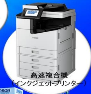
高速複合機 (インクジェットプリンター)