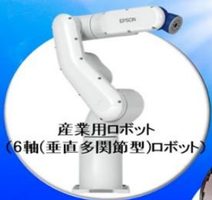
産業用ロボット (6軸(垂直多関節型)ロボット)