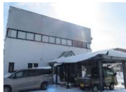
▲有限会社三泰工業所社屋

ポリテクの受講者は即戦力になるためとても信頼しています。 基礎の基礎を学んできているので、指導もスムーズ です。異業種から挑戦する方が多いと思うので、自分の好きなことを見つけてやりがいにしてほしいです。