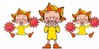
山形労働局マスコットキャラクター「ヤッピー」

〒990-0828 山形市双葉町 1-2-3 山形テルサ 1F ハローワークプラザやまがた TEL 023-646-7360