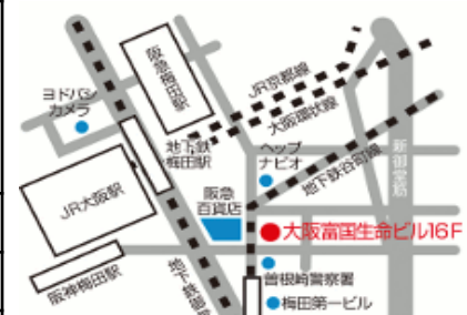
地下鉄梅田駅・JR大阪駅から徒歩3分