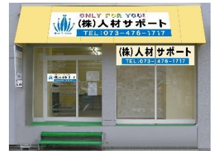
美園登録センター