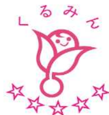
次世代認定マーク「くるみん」