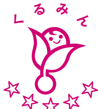
次世代認定マーク「くるみん」