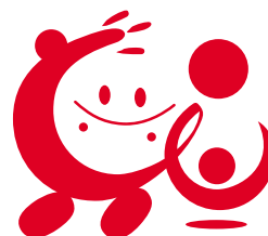
仕事と介護の両立支援のシンボルマーク「トモニ」