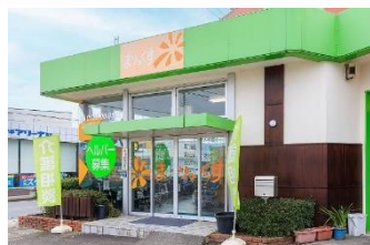
まりっくすサービスセンター本部