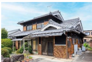
民家型デイサービスまりっくす