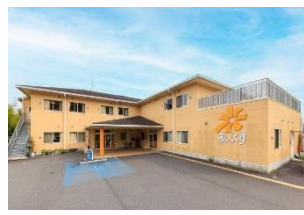
・シニアヴィラジュレ橋本 ・ジュレデイサービス