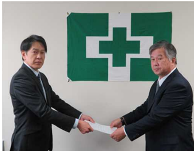
林業・木材製造業労働災害防止協会和歌山県支部