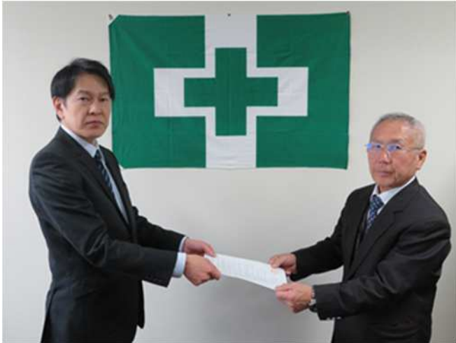
建設業労働災害防止協会和歌山県支部