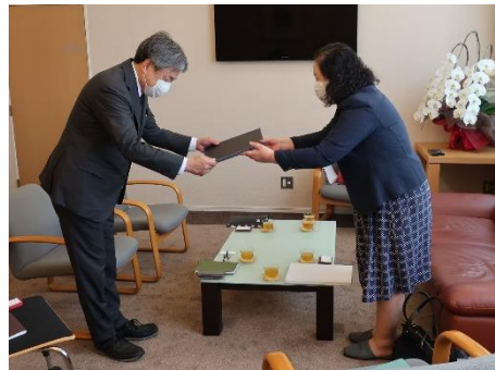
認定通知書交付の様子