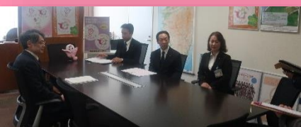
取材対応中（局長室）