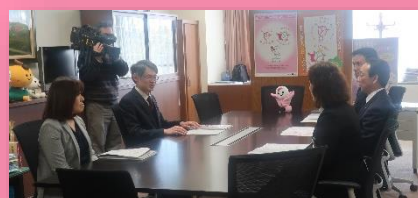
意見交換会の様子（局長室）