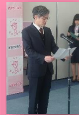
和歌山労働局長による祝辞