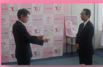
「認定通知書」の交付