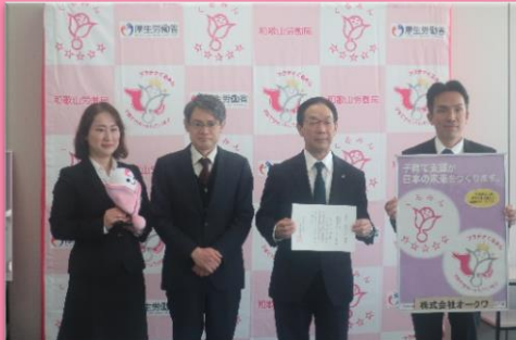
認定企業の皆さまと和歌山労働局長による記念撮影