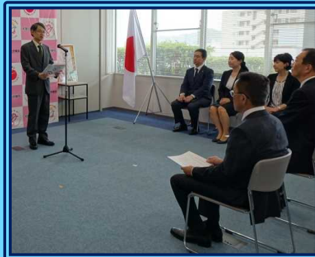
和歌山労働局長の祝辞