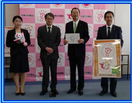
株式会社紀陽銀行のみなさま