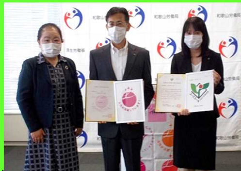
認定企業の皆さまと和歌山労働局長による記念撮影