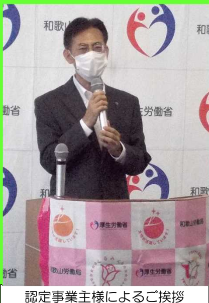
認定事業主様によるご挨拶