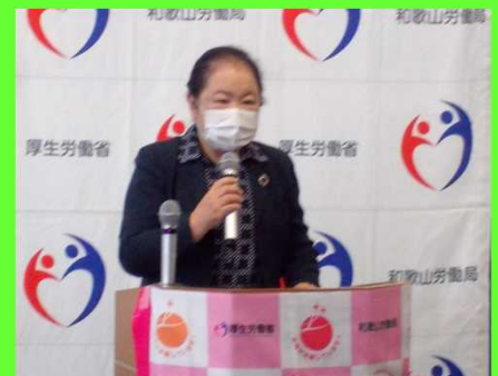
和歌山労働局長による祝辞

祝 東和製薬株式会社 様 えるぼし、ユースエールダブル 認定おめでとうございます！ 祝