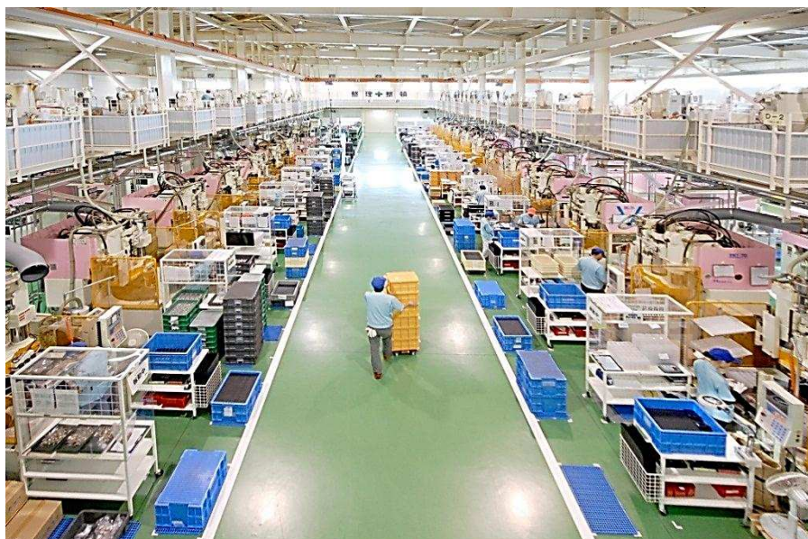
株式会社コージンの工場内の風景

女性が全社員の5割以上を占める中、「女性は男性の補助的な仕事をするもの」といった昔ながらの固定観念の払拭や、女性の活躍の機会を奪うことにもなりかねない女性社員に対する過剰配慮の防止等のため、県などが主催する女性の活躍推進のための各種研修会やセミナー等に女性社員を積極的に参加させている。そうした研修会や