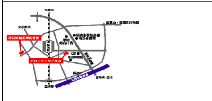
砺波労働基準監督署・ハローワーク砺波