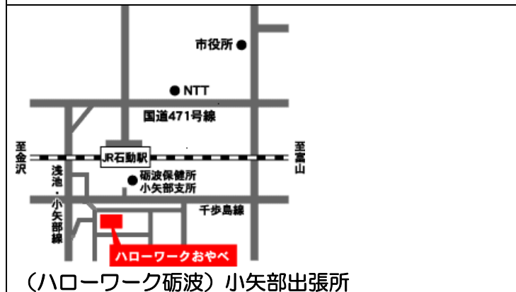
(ハローワーク砺波) 小矢部出張所