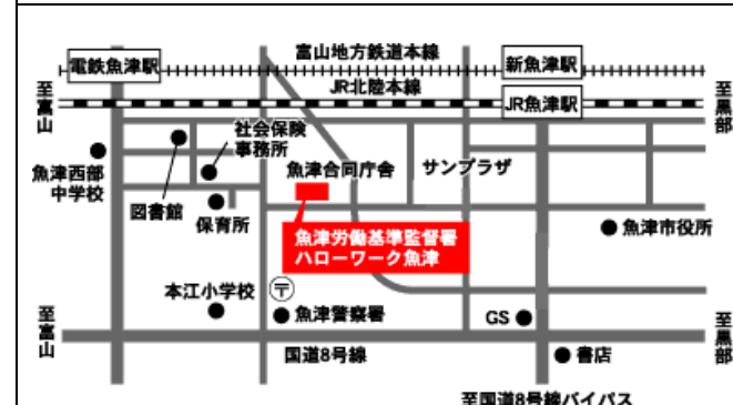
魚津労働基準監督署・ハローワーク魚津