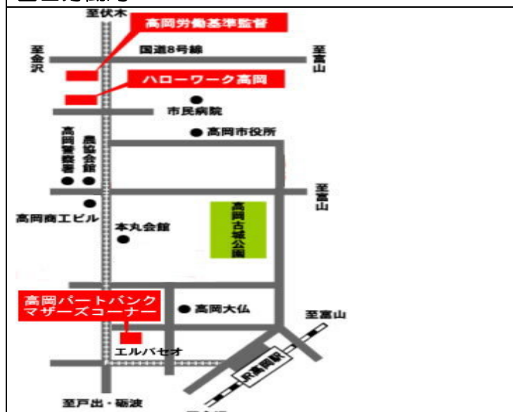
高岡労働基準監督署・ハローワーク高岡