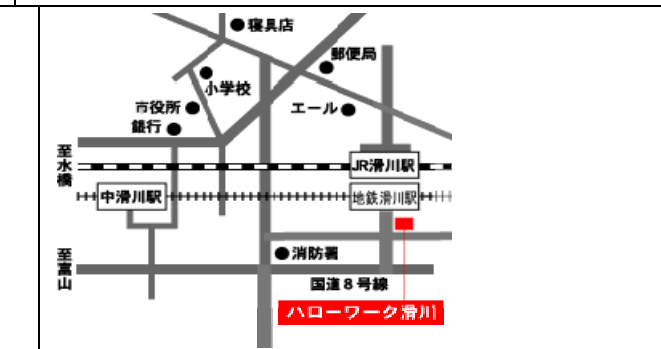
ハローワーク滑川