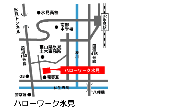
ハローワーク氷見